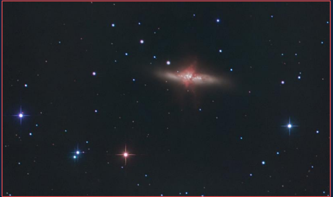
La galaxia del Cigarro fotografiada con telescopio

Los telescopios antiguos podían vislumbrarlo como un objeto largo, denso y brillante, como si se tratara de un cigarrillo encendido en el firmamento nocturno. De ahí que se le conozca popularmente como la 'galaxia del cigarro', en lugar de su nombramiento oficial como objeto Messier 82 o cúmulo NGC 3034.