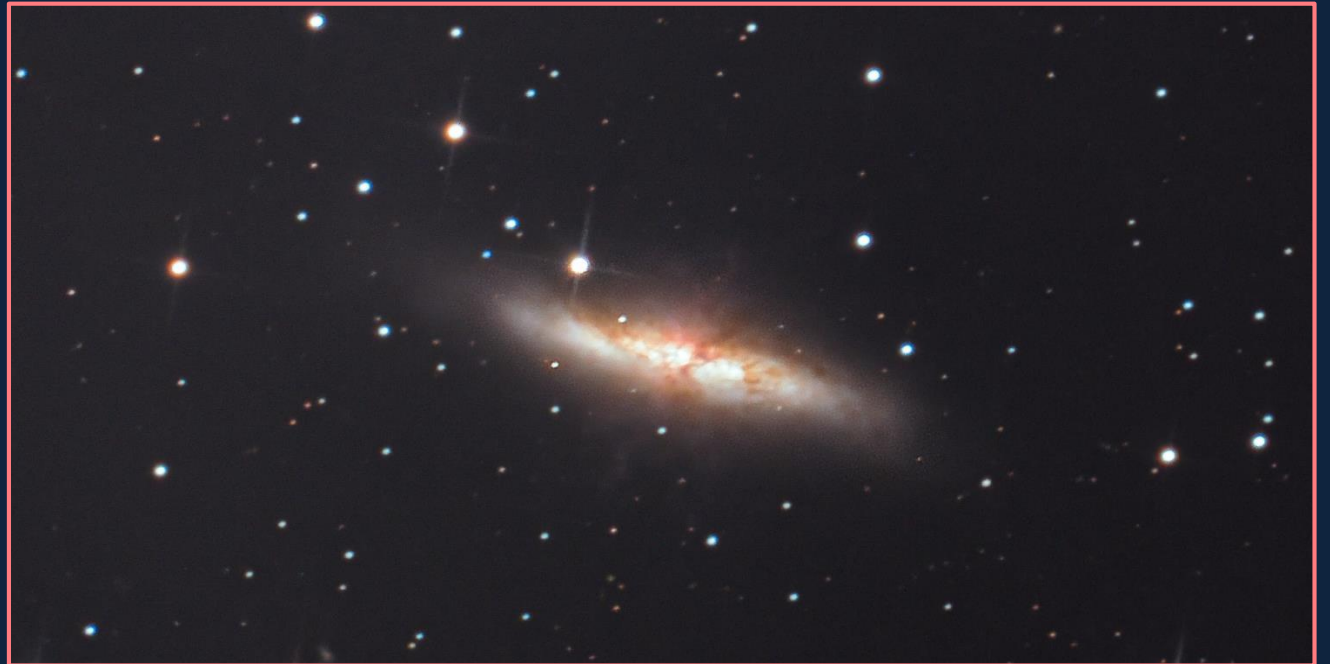
La galaxia del Cigarro fotografiada con telescopio

Los telescopios antiguos podían vislumbrarlo como un objeto largo, denso y brillante, como si se tratara de un cigarrillo encendido en el firmamento nocturno. De ahí que se le conozca popularmente como la 'galaxia del cigarro', en lugar de su nombramiento oficial como objeto Messier 82 o cúmulo NGC 3034.