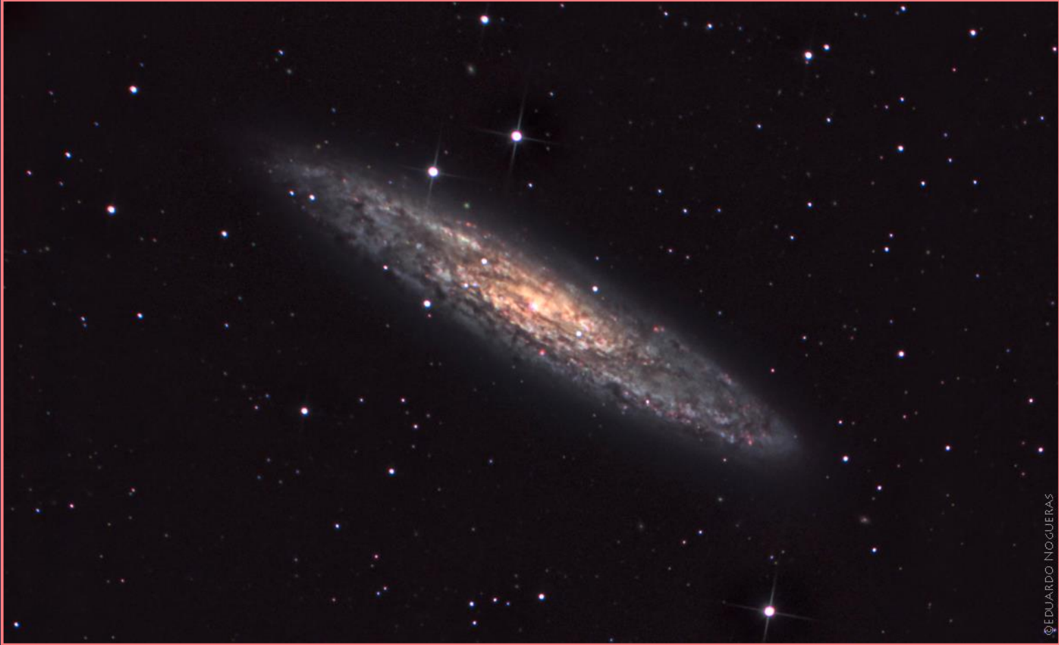
La Galaxia del Escultor brilla en el cielo del PN Sierra de Huetor (Granada)