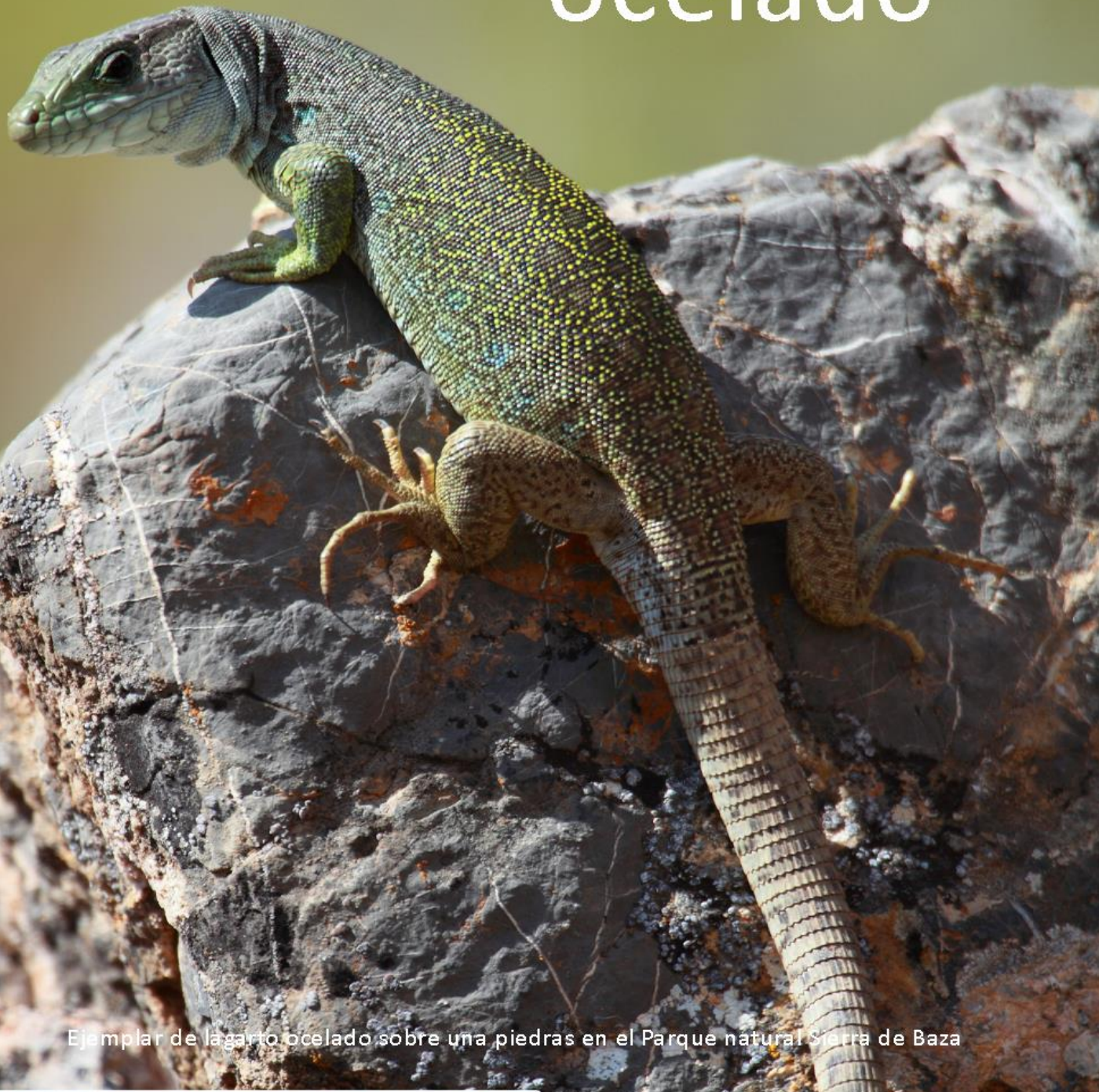
Ejemplar de lagarto ocelado sobre una piedras en el Parque natural Sierra de Baza