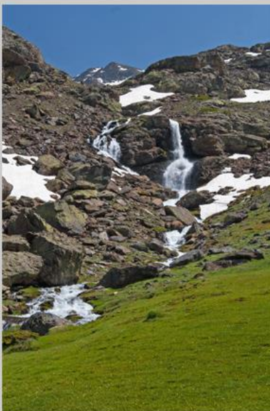
La fotografía de la portada muestra el paraje de los Lavaderos de la Reina en el Parque Nacional de Sierra Nevada