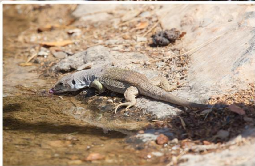
Un lagarto ocelado bebiendo de una charca en verano

El lagarto ocelado es uno de los reptiles más llamativos de los espacios naturales de Granada. Su tamaño es considerable y sus colores vivos hacen que cada encuentro con esta especie se convierta en un acontecimiento singular.