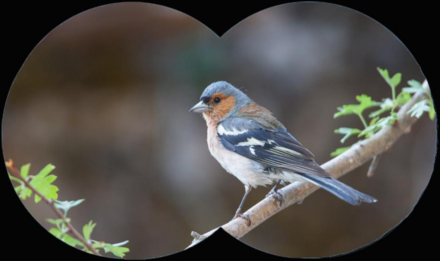
Observando un pinzón vulgar en el PN Sierra de Baza

El pinzón vulgar es una de las especies de aves que hemos observado con más frecuencia en la mayoría de los espacios naturales de la provincia de Granada. Su aspecto y su mayor confianza a la presencia humana nos facilitan una rápida identificación en el campo.