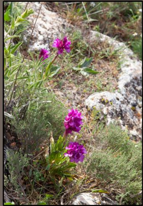
Varios ejemplares de Orchis papilionacea situados en una zona de sotobosque en primavera.