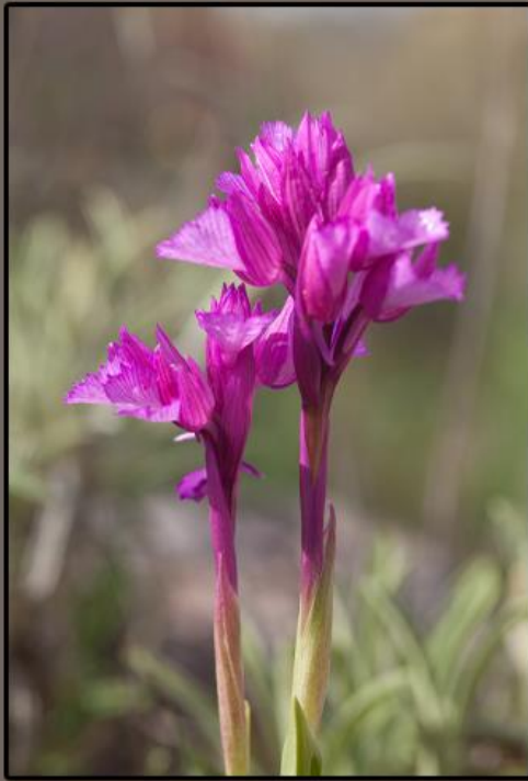
Ejemplar de Orchis papilionacea