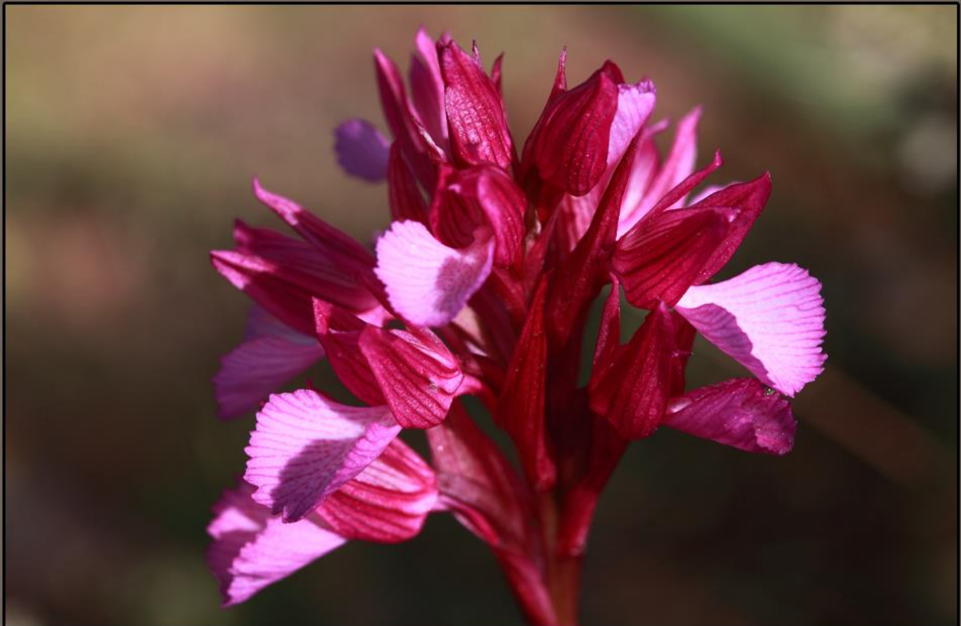
Detalle de las flores de esta orquídea con diferentes tonos de color rosado y violeta. (PN Sierra de Alhama).