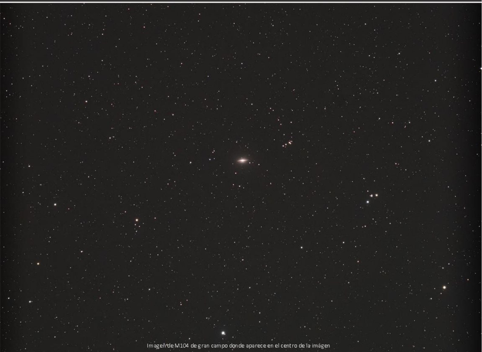
Imagen de M104 de gran campo donde aparece en el centro de la imagen